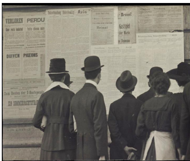
Een onophoudelijke stroom van aanplakbrieven beperkte het doen en laten van de bevolking in het bezette gebied (Brussel, Algemeen Rijksarchief, Fotoverzameling Commissie voor oorlogsarchieven).

De centrale bibliotheek van het Rijksarchief omvat een van de belangrijkste collecties boeken en brochures over de Eerste Wereldoorlog. De catalogus, terug te vinden op www.arch.be , telt vandaag meer dan 40.000 titels. In het najaar van 2013 zullen het Rijksarchief en het Koninklijk Museum van het Leger en de Krijgsgeschiedenis een update uitbrengen van de bibliografie over de Eerste Wereldoorlog.