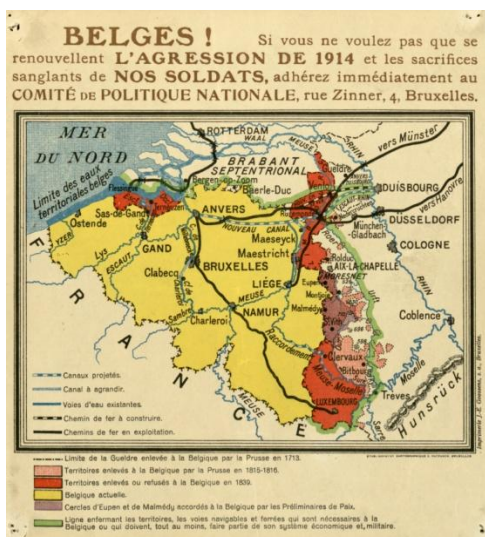
Kaart met aanduiding van de gebieden die het Comité de politique nationale bij België wou aanhechten na de oorlog (Brussel, Algemeen Rijksarchief, Verzameling Corneille Gram, nr. 33).

Vandaag zijn duizenden van deze stukken raadpleegbaar in de leesalen van het Rijksarchief. In 2010 verscheen een lijvig 'Archievenoverzicht betreffende de Eerste Wereldoorlog in België' , met een gedetailleerde beschrijving van alle openbare en privéarchiefbestanden die in België en het buitenland beschikbaar zijn over dit onderwerp. Met dit onderzoeksinstrument faciliteert het Rijksarchief de toegang tot de archieven, stimuleert het innovatief onderzoek en biedt het hulp bij de voorbereiding van de talrijke tentoonstellingen en andere evenementen die in de komende maanden worden opgestart 1 . In die context ging het Rijksarchief ook over tot de restauratie van een honderdtal van de meest interessante en emblematische affiches uit 14-18.